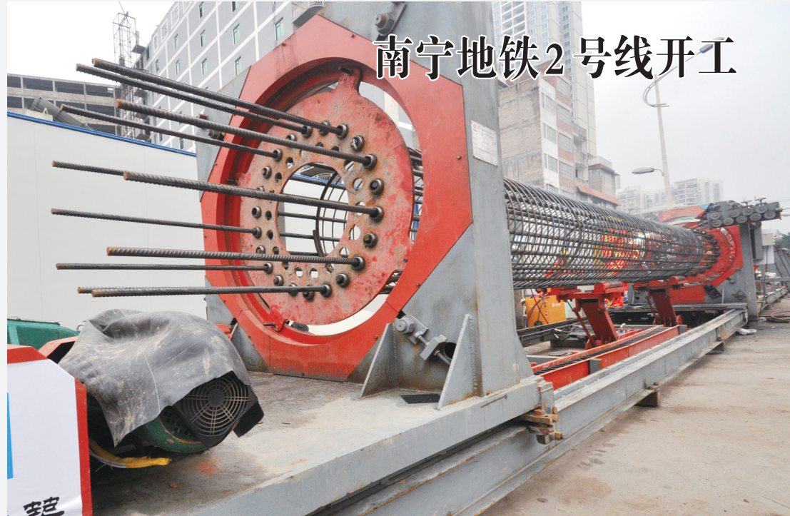
3月28日上午,中建股份总承包、中建八局负责施工的南宁地铁2号线土建5标白沙大道站工程经过项目部一个多月的精心准备,在全线18座站点中率先开工。为加快施工进度、保障质量,项目采用了每天可加工10个长达25米的钢筋笼滚焊机。图为正在运转中的钢筋笼滚焊机。