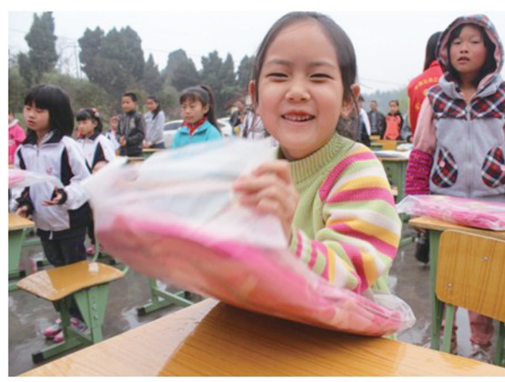
3月30日,中建五局三公司20多名青年志愿者来到四川金堂县五凤留守儿童之家,为孩子们送上文体用品等共120套。