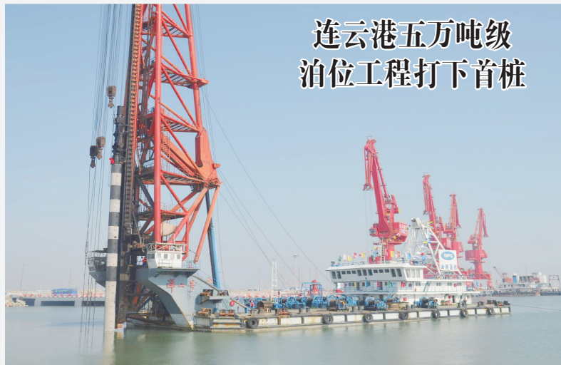
3月22日上午,中建港务连云港徐圩港区五万吨级通用泊位工程举行开工仪式,并顺利打下第一根桩,为落实“大市场、大客户、大项目”营销战略迈出了新一步。该码头总长280米,平台总宽40米,采用高桩梁板式结构。

近日,中建一局六公司江苏昆山花桥项目“自排式自动洗车设施”获得了国家实用新型专利,较好解决了现有洗车设施冲洗工程运输车辆时,清洗不干净、冲洗时间、投入成本高等问题。