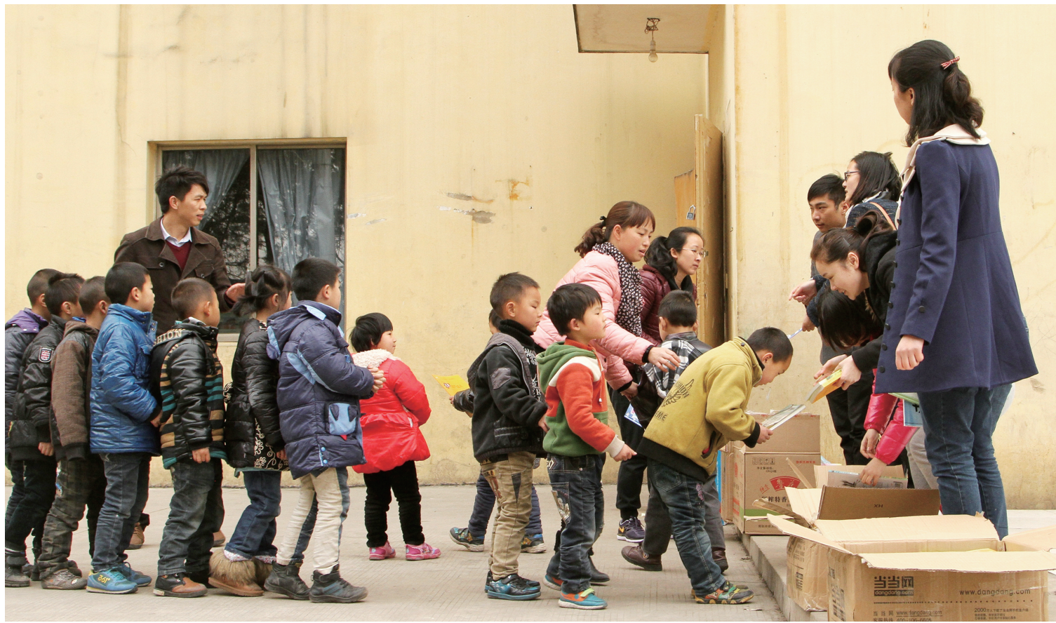
日前,中建四局科研院12名青年志愿者来到农民工子弟学校——贵州焜瀚文武学校,为100余名农民工子弟送去了书籍及文具用品。