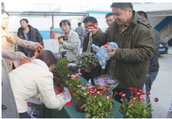
近日,在中建三局工程总承包公司天津117土建施工部,员工凑够5个饮料瓶就可换一盆绿植。