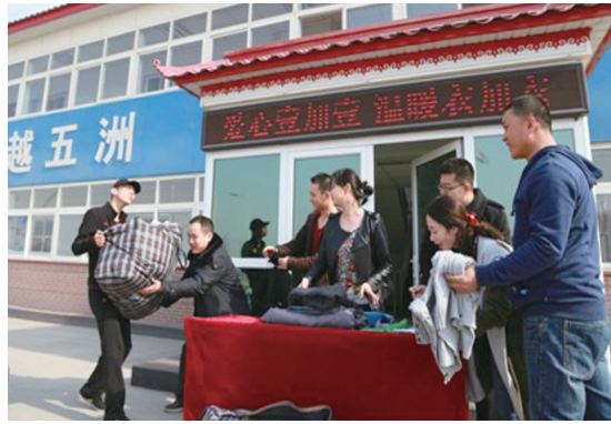
日前,中建六局天津地铁6号线项目部向拉萨定点援助对象募捐衣物,活动共收集到衣物200余件。