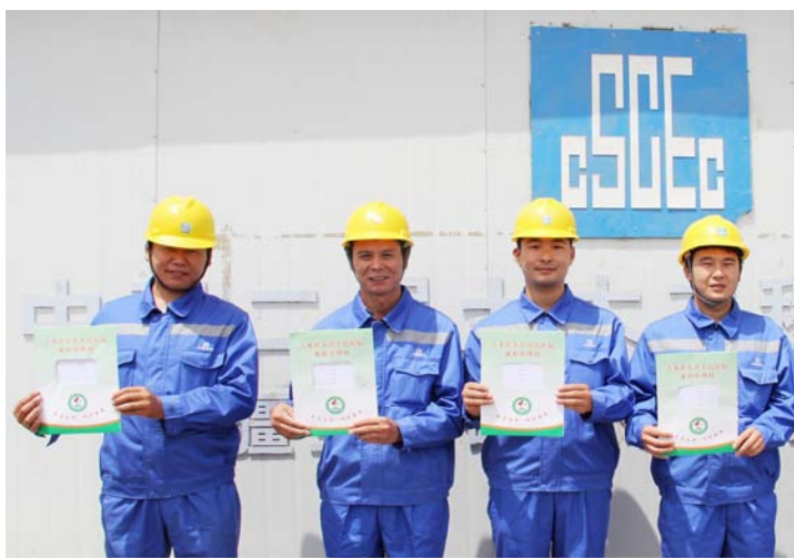
近日，中建二局土木公司新疆项目组织100余名农民工到吉木萨尔县医院进行了体检。考虑到该项目矿山高粉尘作业的特点，此次体检专门增加了肺功能、X光机胸片体检项目，并为500余名农民工建立了职工档案。（张俊值）