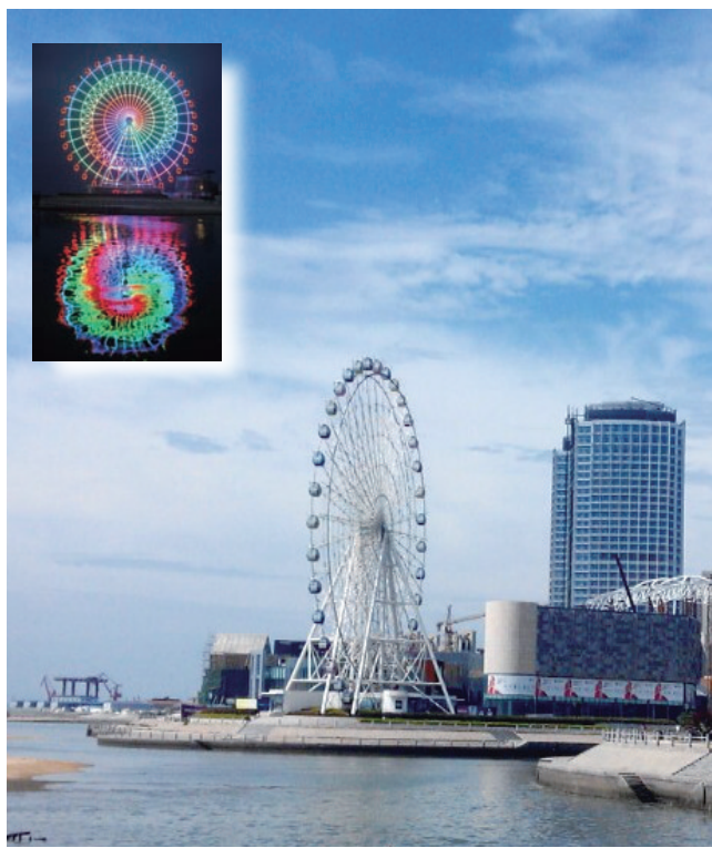
近日,中建三局总承包建设的山东省首座海景摩天轮——青岛海上嘉年华“青岛之眼”摩天轮正式投入运营。该摩天轮高68米,直径65米,全建筑采用放射辐条式进行拼接,有36个全透视海景观景轿厢,是华北地区唯一可实现百种变化、绚丽绚丽夜间灯光秀的摩天轮(如小图所示)。(丁腾飞)