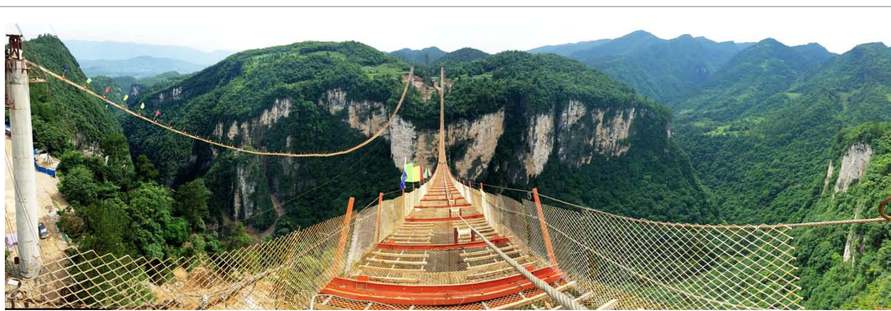
张家界大峡谷玻璃桥300米高空架“猫道”建成后将成为世界上最高、最长的玻璃桥

本报讯(记者廖东红)近日,中宣部、中国政研会作出《关于2014年团体会员单位课题研究获奖的决定》。中建总公司政研会推荐报送的两项课题研究获奖,其中《中建交通文化绩效评价研究》获得一等奖,《中建五局“超英爱心疏导室”实践与研究》获得二等奖。