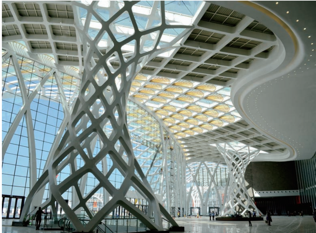
近日,第三届中国南亚博览会在昆明滇池国际会展中心成功举办。该会展中心由中建钢构负责外网钢结构深化设计、制造和安装,采用了变截面薄壁异形空间弯扭全焊接结构,体量1.1万余吨。图为会展中心内景。(边小晶)