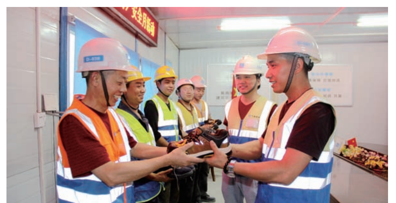
中建三局一公司安装公司项目施工和管理人员正在领取安全鞋

本报讯(通讯员刘芳青)近日,为加强安全管理和人员保护,中建三局一公司安装公司斥资180万元为所有在建项目的近千名管理人员和一万多名劳务工人配发安全鞋。这批安全鞋采用AN1级标准钢包头,能抵御200J撞击力和承受15000N的静压力,鞋底设置了国家特级标准防穿刺钢板,最大可承受1100N的穿刺力,具有优良的防滑、防砸、防穿刺功能。此次大规模配发安全鞋,在国内建筑企业尚属首次。目前,杭州绿地旭辉城项目部已率先为78名劳务工人发放了安全鞋,公司其他项目部也将陆续发放。