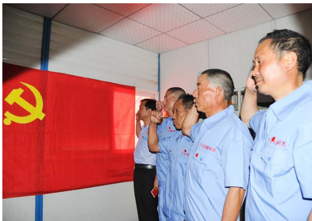
近日，中建七局总承包公司为郑州农村项目部12名农民工党员上了一堂党课。据悉，该公司党委将继续在鹤壁、三门峡、许昌、安阳等城市开展送党课进农民工宿舍活动。图为党员们重温入党誓词。（张博 明安宁）

该移动集装箱式洗浴间具有以下优点：一是坚固耐用。全钢结构材料制造，全焊接结构，抗震、防水、防风、防火、防腐；二是环保节能。整体吊装和转运，安装时不产生任何作业垃圾；可以循环使用达十五年之久，周转5-6个项目；洗手间内部采用红外自动冲水，不锈钢节水器具，声控感应LED灯，且冲洗用水是收集工人淋浴间废水；三是组合灵活。箱式房为整体结构，用吊车可以快速运输到目的地，现场吊装，且拆卸方便。