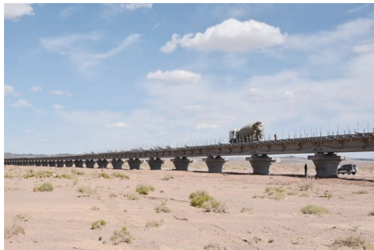
近日,中国建筑首条戈壁铁路——额(济纳)哈(密)铁路项目主体工程提前完工。额哈铁路地处阿拉善戈壁深处,全长123公里,包含52座桥、400座涵洞,由中建六局铁路公司施工。(尹志强)