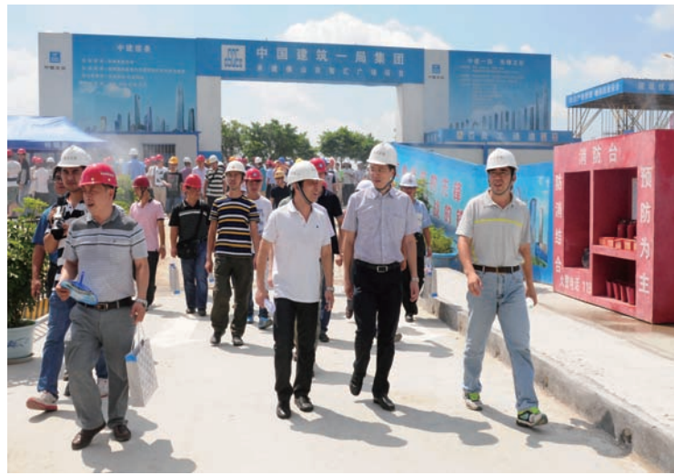
近日,佛山市顺德区国土城建和水利系统2015年上半年安全生产工作会议暨开展示范工程项目质量安全观摩活动在中建一局华南公司佛山智汇广场项目举行,近一千人参加了本次活动。(叶荣海 桑秋杰)