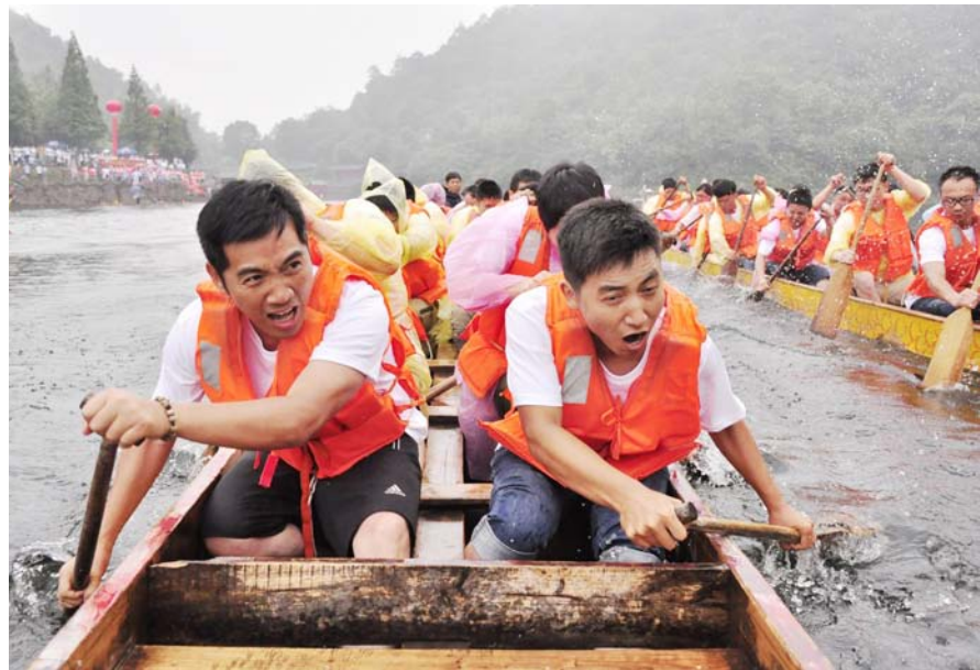
近日，中建五局总承包公司“超英杯”龙舟竞赛在长沙石燕湖举行，这是该公司连续第五年举办此项活动。赛前，该公司16名太极拳爱好者还进行了太极表演。（彭 蓉）