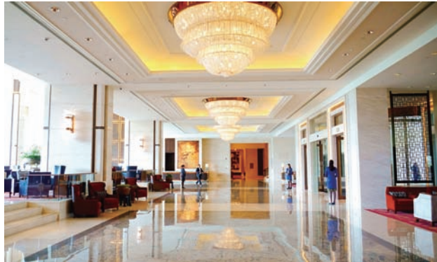
融入蒙古国文化元素装饰后的酒店大堂,传统华丽典雅

带着兴奋与自豪,近日中建装饰华鼎装饰公司在乌兰巴托项目施工的最后一批人员回到国内。他们走出国门3年多,完成了第十一届亚欧首脑会议的主会场——蒙古首都乌兰巴托香格里拉酒店的装饰,李克强总理以及亚欧多国领导人见证了他们在海外完成的第一个精品之作。