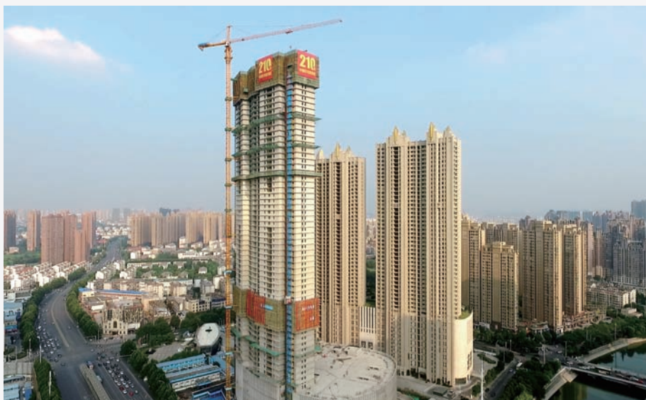
近日,由中建二局上海分公司承建的合肥坝上街环球中心二期完成主体结构封顶。该建筑高210.55米,是迄今为止国内最高的框剪结构住宅楼。(童凡)