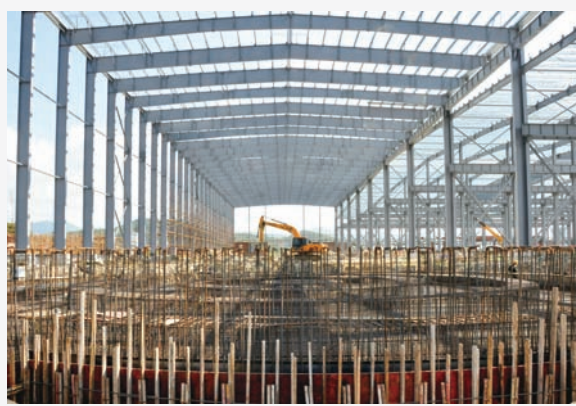
近日,中建安装化工设备公司承建的舟山恒安泰海海洋管产业化厂区钢结构厂房项目先后完成了桩基、基础、材料制作三大工程节点,初见雏形。(安壮轩)