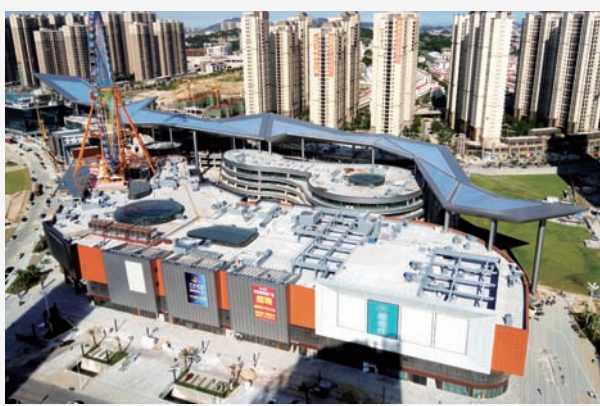
近日,中建三局三公司厦门分公司承建的石狮世茂南区商业项目通过竣工验收。据悉,该商业项目总建筑面积约有15万平方米。(苏龙辉)