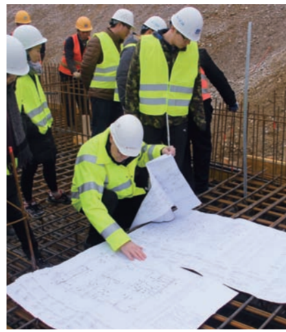
工程主验收人、设计师雷格查看图纸设计,仔细验收底板钢筋绑扎情况。

反而自我要求更高了。每次验收,项目技术人员都细心记录,虚心向德国专家学习管控工程品质的先进经验。