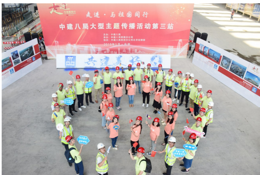
5月22日，中建八局“走，与祖国同行”大型主题传播活动来到八局西南公司北京亚投行项目，纪念57个意向创始成员国就《亚投行章程》文本达成一致四周年。来自赞比亚、印度尼西亚等“一带一路”沿线国家的留学生、北京大学国际关系学院学生及项目员工代表等就“青春、梦想、使命”等话题展开讨论，在交流中激发文化融合灵感。图为11国青年围成同心圆，表达“一带一路，共享美好生活”的寓意。（李煜）