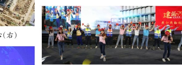
演绎超燃快闪《我和我的祖国》