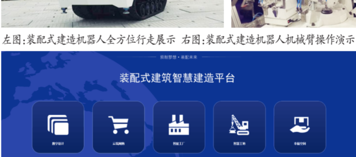
装配式建筑智慧建造平台