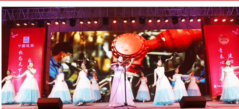
5月21日，中建成都轨道交通建设指挥部举办“青春心向党·建功新时代”青年才艺展示大赛，纪念“五四”运动100周年，庆祝新中国成立70周年。成都轨道交通11号线一期工程全线工友、青年、员工家属代表共计200余人观看演出。节目由项目建设者自编、自排、自演，展现出建设者团结拼搏、争先有为的精神风貌。（雷晶）

青春心向党，建功新时代。未来，中建三局三公司西南分公司团委将勇担使命，让青春焕发出更加绚丽的光彩。（张连杰、马胜男/文）