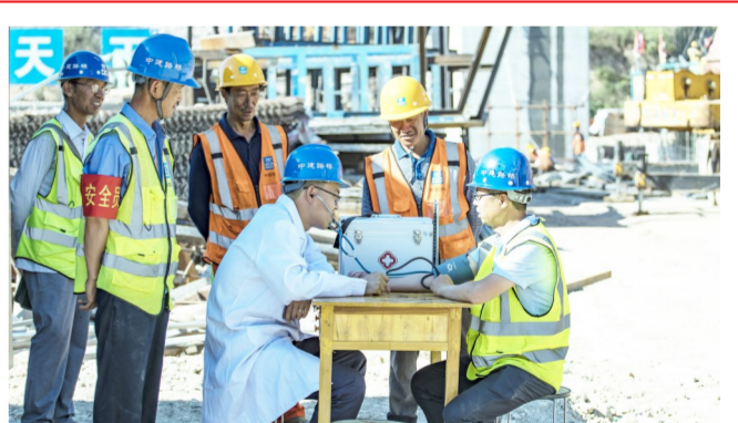
5月22日，邯郸市涉县最高气温达38℃以上，中建路桥第一分公司开展“心系工友安全，健康大普查”活动，为职工、工友进行健康普查，排查健康隐患，建立健康档案。图为该公司涉县项目部为建设者测量血压、发放药品。（王绍旭、胡文静）