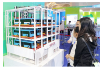
全自动新能源公交立体车库模型