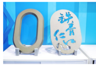
等离子切割产品和火焰坡口机器人切割产品