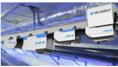
综合管廊智能巡检机器人