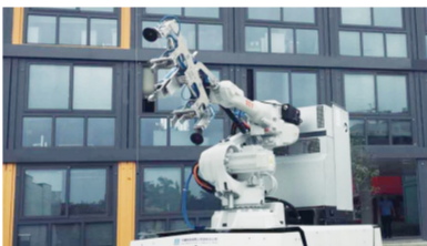
装配式建造机器人全方位行走展示