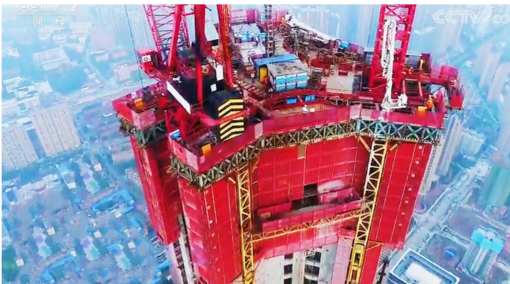
大国重器——“空中造楼机”

小小的体积，大大的容量，占地380平方米，还不到一个篮球场大，5个公交车位却停下了12辆公交车，这就是以钢结构为主体的全自动新能源公交立体车库。针对全国各地普遍存在的公交车停车场空间不足、旅游景区大客车停放难、新能源公交车充电难等问题，中建钢构研发了集停车、充电、维修、调度于一体的全自动新能源公交车立体车库。该类公交车停车设备最高可设置10层，土地利用率提高6倍，同时可采用指纹、刷卡、面部识别、智慧停车APP等多种方式完成存取车，平均存取时间仅130秒/车。车库配备完善的智慧管理系统，实时监控车库的运行情况，并与公交车站智能调度系统有机结合，能够有效解决现代城市公交车无序存放和充电难等问题。