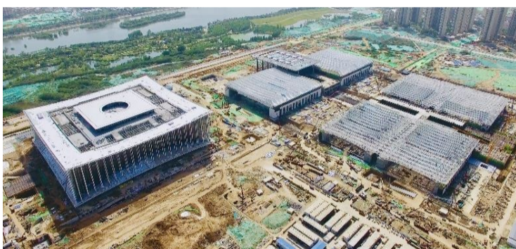
建设中的西安丝路国际会议中心(左)、西安丝路国际展览中心(右)