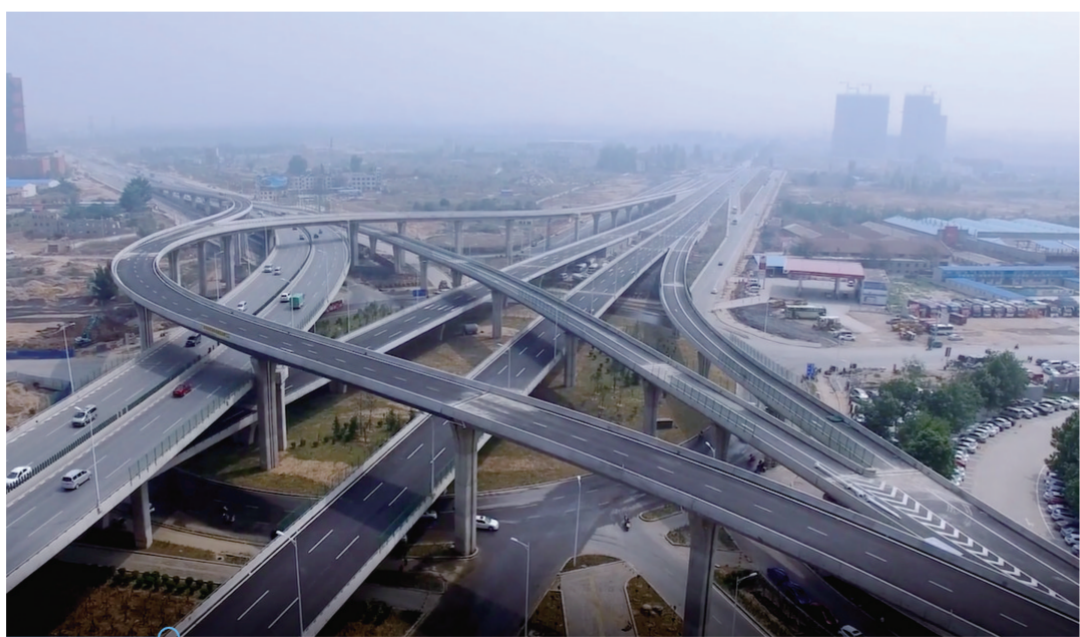
近日,中建七局郑州公司投资建设的郑州市中州大道与郑新快速通道互通立交项目竣工验收。该立交项目由两条主线和四条匝道组成,加上地面环形转盘路,上下共4层,共解决了30多个出口转向问题,一度被市民称为“郑州最复杂立交”。(艳志 永利)

在国家政策指引下,综合管廊市场正如雨后春笋般迅猛发展,中建三局投资发展公司将切实履行好央企在城市管廊建设中的“国家队”责任,争当国家使命担当者、市场开拓领跑者和各级地方政府的最佳城市合伙人。