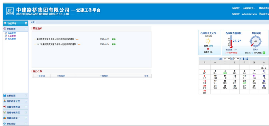
中建路桥“互联网+党建”平台上线

近日,中建路桥“互联网+党建工作平台”上线。该平台覆盖了公司党委、子企业党总支(党工委)和项目党支部三级党组织和全体党员,各级党组织可以在线上申报材料,上级党组织可以在线审核评分,并进行考核排名和数据归档。(侯双全)