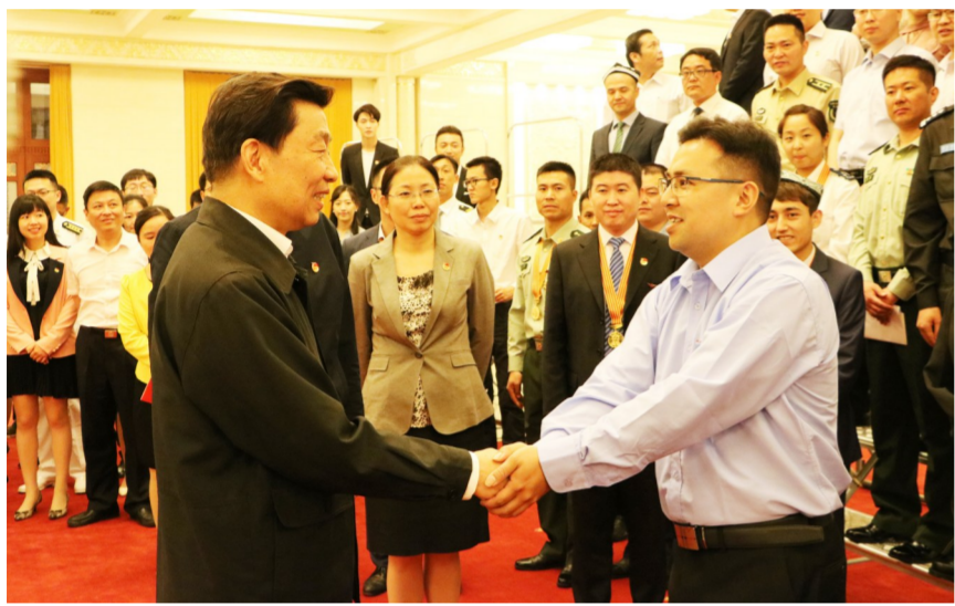
中共中央政治局委员、国家副主席李源潮亲切接见连李辉