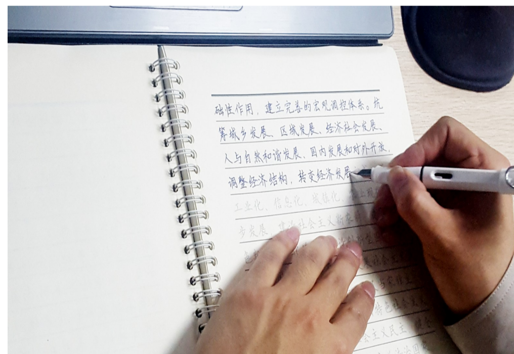
中建八局大连公司开展“字帖+党章”学习活动

中建一局党委将主动向党中央看齐,进一步提高做好党建工作的责任感和紧迫感,紧密结合企业改革发展情况,不断丰富和完善大党建格局,确保党组织在企业的地位和作用,将党组织的政治优势转化为企业竞争优势。