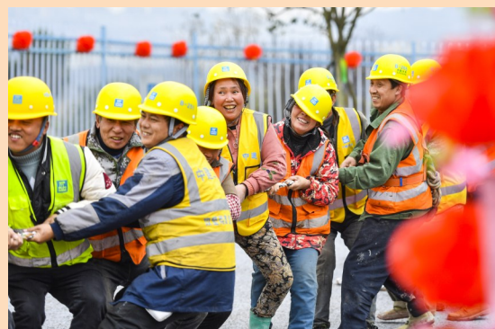
1月24日，中建二局西南公司开展“关爱农民工，温暖回家路”迎新春活动，通过工地运动会、疫情防控宣传教育、依法维权政策宣讲、赠送新春大礼包等方式，温暖工友春节回家路。(樊艳萍、赵盼)