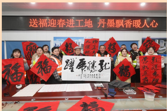
1月21日，中建五局安徽阜南肿瘤医院项目开展“送福迎春进工地 丹墨飘香暖人心”活动，邀请著名书法家走进项目现场，通过写春联、送“福”字的方式，送上新春祝福，现场洋溢着浓浓的年味儿。(肖慧慧)