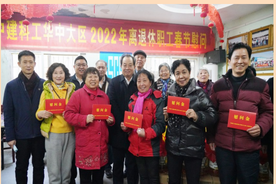
1月19日，中建科工华中大区工会开展离退休职工节前慰问暨新春茶话会特别活动，为退休老职工们送去了节日的慰问和祝福。茶话会上，大家促膝攀谈，聊家常，共话企业发展。(王鑫)