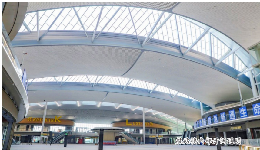
航站楼内部穹顶透明

项目施工区域面积大、工艺复杂,为顺利推动进度并确保混凝土施工质量,项目团队借鉴了国内外航站楼先进做法,现场进行同条件1:1足尺和1:2缩尺