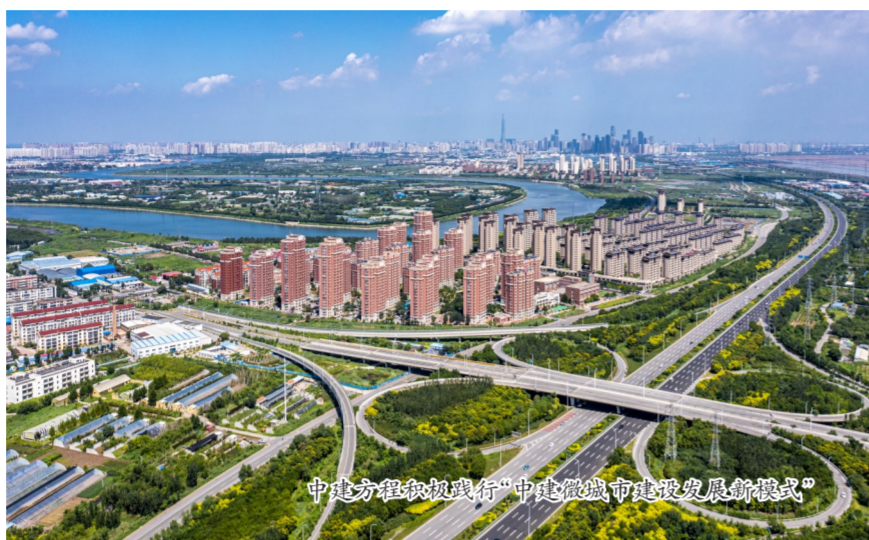
中建方积极践行“中建微城市建设发展新模式”

到高效安全的城市治理。在中建方团队综合运营平台的实时监测下,城市井盖、路灯、环境监测等各处细节一目了然。这座靠海河而生的微城市左手霓虹、右手田园,糅合出一幅幸福元素交叠的美好画卷。