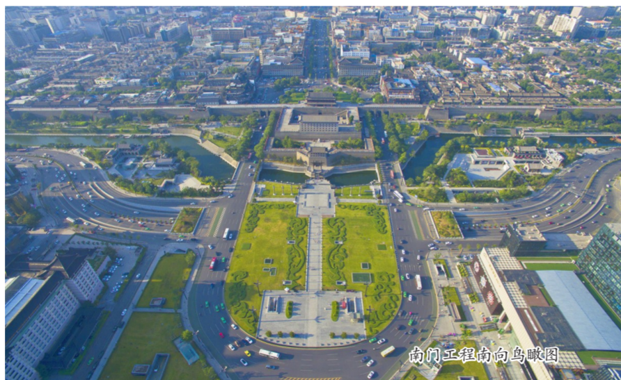
南门工程南向鸟瞰图

有机生命体,不能只将其“罩在玻璃展示柜里”,只有适当利用才是最好的保护。把遗产融入当代生活,使其与人们的生活相容,是保护的关键。改造完成的南门区域集文物保护展示、护城河历史风貌游览、区域立体式交通、城墙文化旅游活动于一体,以崭新、亮丽、古朴、生态的新面貌展示在世人面前。立体交通既缩短了路程又保障了游人的安全,修复后的护城河水清澈,滨水空间成为市民游憩的理想场所,夜晚亮化设计更增添了南门区域的现代气息。